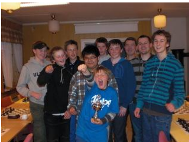
NSKUs vinnerlag i pokalkampen. Jippi!!!