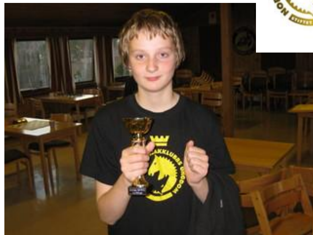
NSKU's flittigste turneringsdeltager i 2010?